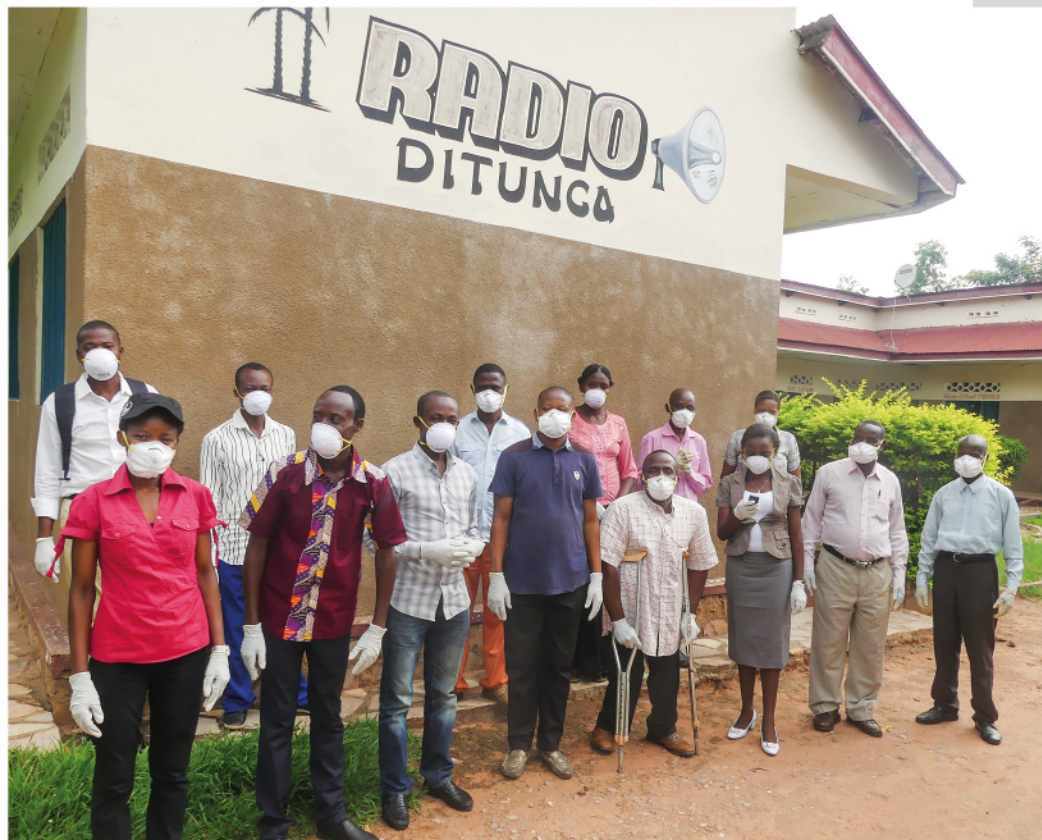
Radio Ditunga durante la pandemia