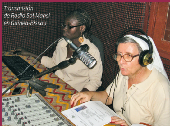
Transmisión de Radio Sol Mansi en Guinea-Bissau

EL ESFUERZO DE AYUDA A LA IGLESIA NECESITADA QUE FINANCIÓ 35 RADIOS