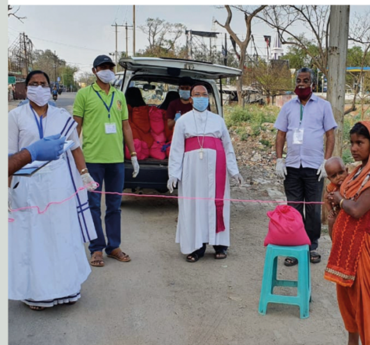
El obispo y algunas religiosas de la diócesis india de Hazaribag, llevan comida a familias pobres. ■