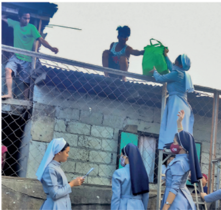
Las Hermanas de San Carlos Borromeo ayudan en las zonas más pobres de Tagaytay, en Filipinas.