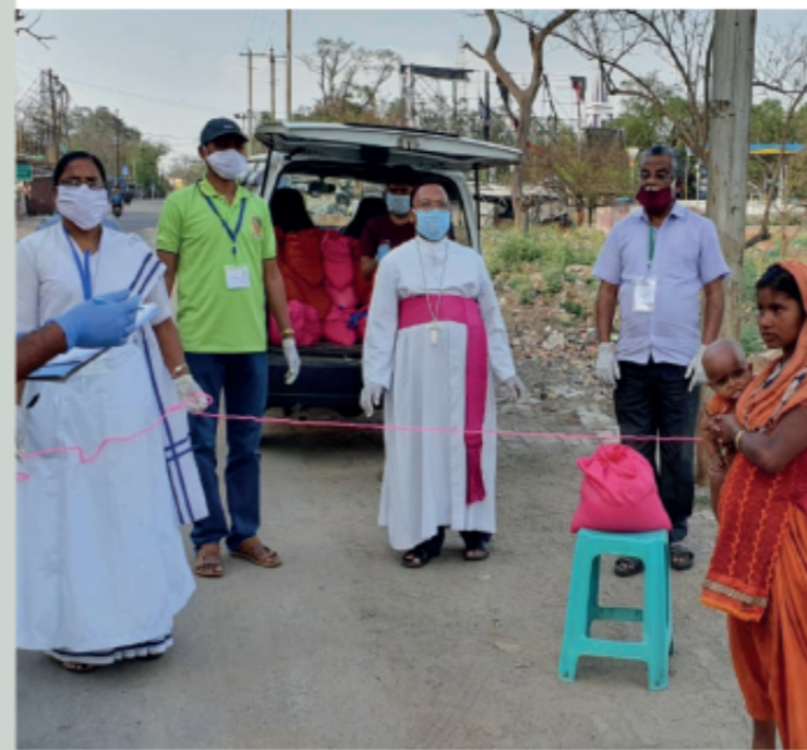
El obispo y algunas religiosas de la diócesis india de Hazaribag, llevan comida a familias pobres.