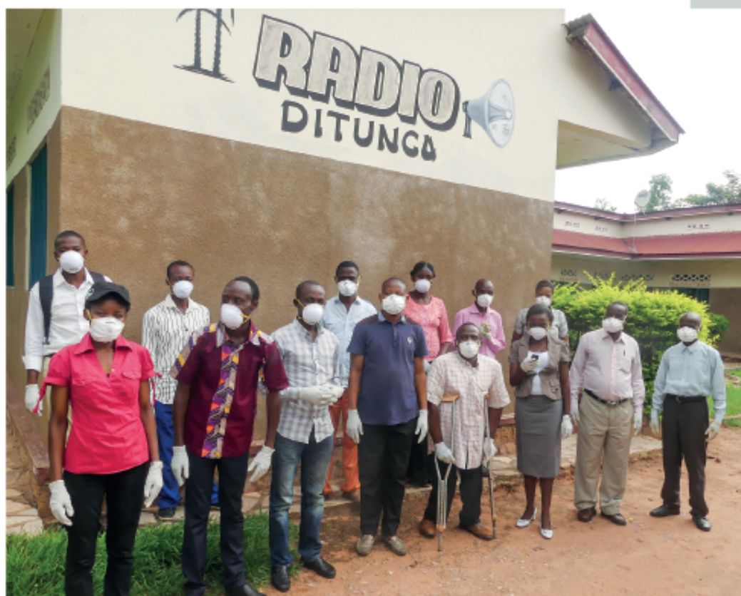
Radio Ditunga durante la pandemia