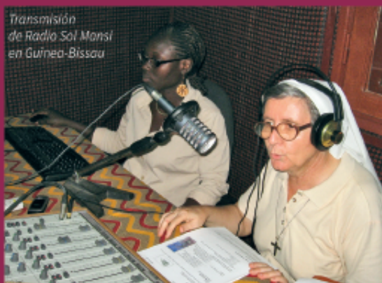
Transmisión de Radio Sol Mansi en Guinea-Bissau

EL ESFUERZO DE AYUDA A LA IGLESIA NECESITADA QUE FINANCIÓ 35 RADIOS