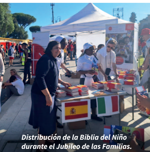
Distribución de la Biblia del Niño durante el Jubileo de las Familias.

Necesitada lleva publicando desde hace 46 años ya se han hecho traducciones a 194 idiomas y se han impreso más de 51 millones de ejemplares. Ahora se ha modernizado el diseño y se ha completado con ideas para la catequesis, mientras permanecen las populares ilustraciones originales. Los primeros 10.000 ejemplares los distribuyó Ayuda a la Iglesia Necesitada el 31 de mayo en Roma, en el marco del Jubileo de las Familias.