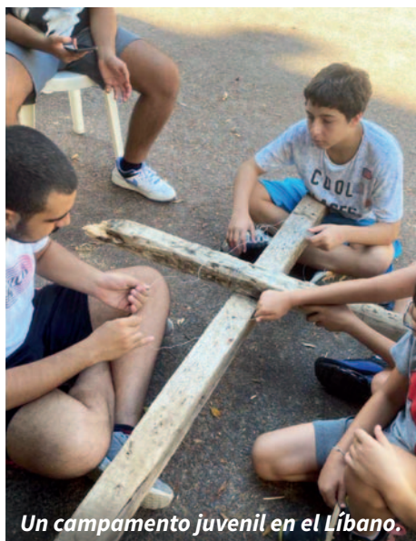
Un campamento juvenil en el Líbano.

¿Te gustaría contribuir a que estos niños y jóvenes crezcan en la amistad con Jesús y la amistad entre ellos?