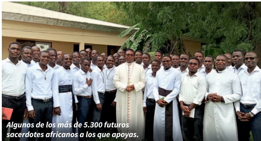
Algunos de los más de 5.300 futuros sacerdotes africanos a los que apoyas.