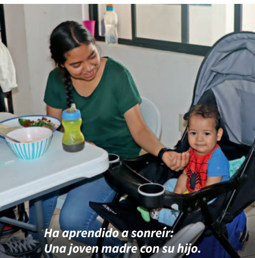
Ha aprendido a sonreír: Una joven madre con su hijo.

Nosotros hemos prometido 493.000 pesos para un vehículo. ¿Quién nos ayuda a financiar esta ‘ambulancia de salvamento de almas’?