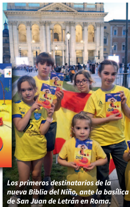
Los primeros destinatarios de la nueva Biblia del Niño, ante la basílica de San Juan de Letrán en Roma.