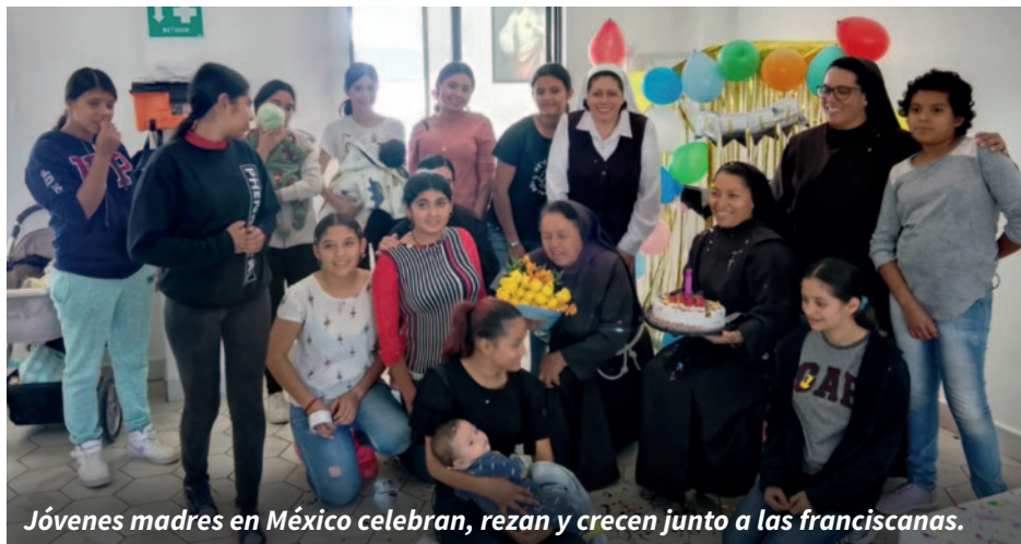
Jóvenes madres en México celebran, rezan y crecen junto a las franciscanas.

“No necesitan médico los sanos, sino los enfermos”, dice el Señor en el Evangelio. Desde Latinoamérica nos llegan maravillosos testimonios de como la gracia de Dios cura las almas.