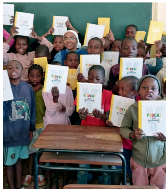
La alegría de unos niños mozambiqueños por el YOUCAT para niños.