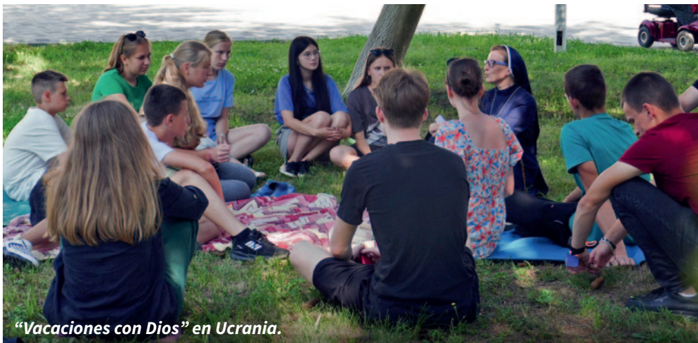
“Vacaciones con Dios” en Ucrania.

Cuando el Papa Francisco visitó Iraq en marzo de 2021, bendijo en la Santa Misa celebrada en Erbil una estatua restaurada de la Virgen María procedente de Karamlech, que había sido decapitada por los terroristas. Y, como símbolo del renacimiento de la presencia cristiana, la imagen se devolvió a su lugar de origen. Y es que también muchos cristianos han retornado a sus lugares de origen tras la derrota de las