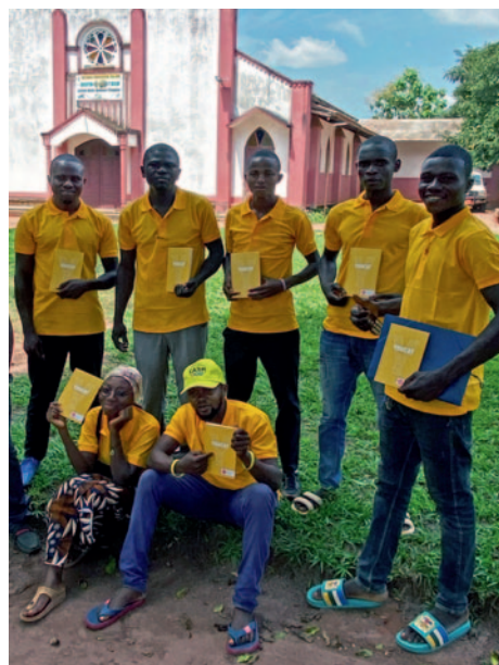
El YOUCAT en la República Centroafricana.