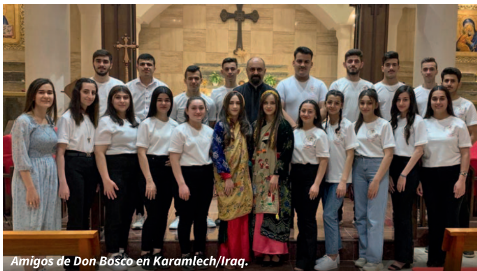
Amigos de Don Bosco en Karamlech/Iraq.