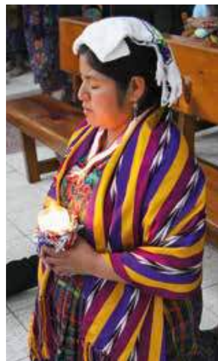
Santa Misa en la iglesia de Santo Tomás Apóstol, Paquip.

Para contrarrestar la falta de sacerdotes en el país, ACN financia, como en casi toda América Latina, la formación de catequistas y de seminaristas. También se ayuda a los sacerdotes con estipendios de misas y a las monjas con subsidios para su manutención. Otros fondos se destinan a la financiación de medios de comunicación católicos, a la construcción de iglesias, casas parroquiales y otros edificios eclesiales y a la compra de vehículos para la asistencia pastoral.