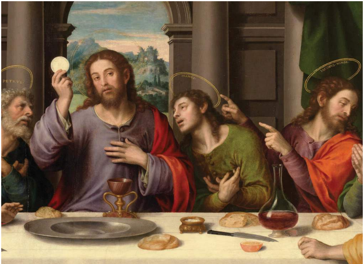
Foto: Fragmento. La última cena 1555 y 1562. Juan de Juanes. © Museo del Prado

Para la representación gráfica de una renovada comprensión bíblica, patristica y dogmática de la devoción al Sagrado Corazón de Jesús, que se corresponda con nuestra sensibilidad actual, podemos servirnos de dos pasajes del Evangelio de Juan. Están, por un lado, las representaciones medievales del amor a Cristo (en alemán, Christusminne ), que muestran al discípulo amado descansando sobre el pecho o el corazón de Jesús (cf. Jn 13, 23). Estas representaciones pueden ilustrar que, en medio de la inquietud y el ajeteo del mundo, existe un lugar en el que nos es dado alcanzar sosiego y paz interior.