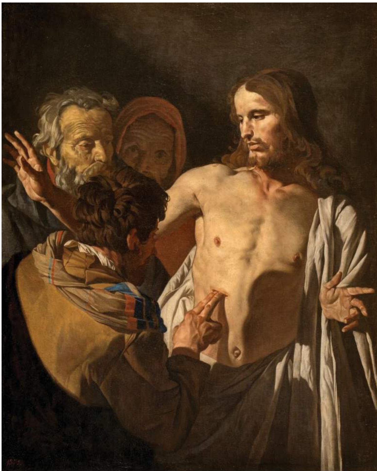
Foto: La incredulidad de santo Tomás. Matthias Stom. Palacio Real Nuevo, Madrid.

Como Tomás, así también el hecho de que semejante devoción al Sagrado Corazón de Jesús sea, por naturaleza, cordial —más aún, sentimental, en el buen sentido de la palabra— no debe ser un argumento en contra de ella. Pues el corazón y las emociones forman parte legítima de la devoción y tienen en ella un lugar irrenunciable. Allí donde son proscritas, aflora la desordenada y verdaderamente desenfrenada emocionalidad que hoy, a menudo, encontramos. No debemos permitir que se nos prive de las emociones, ni tampoco tenemos por qué avergonzarnos de ellas.